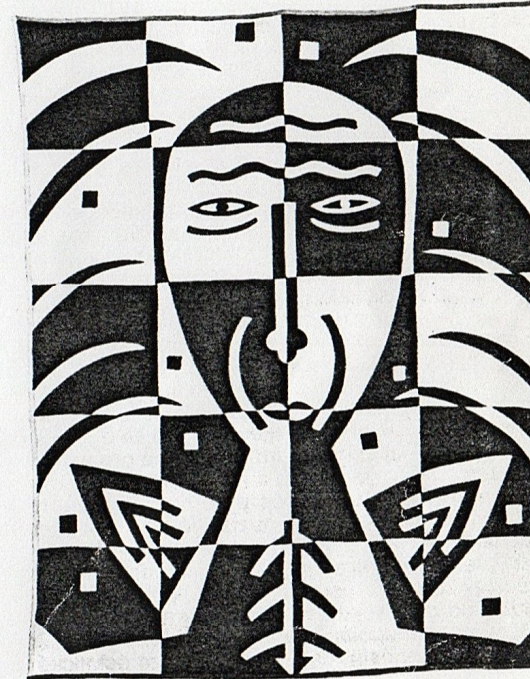
Zuzana Krajčovičová, Aniel, 1996, textilní intarzia, 200 x 150 cm.