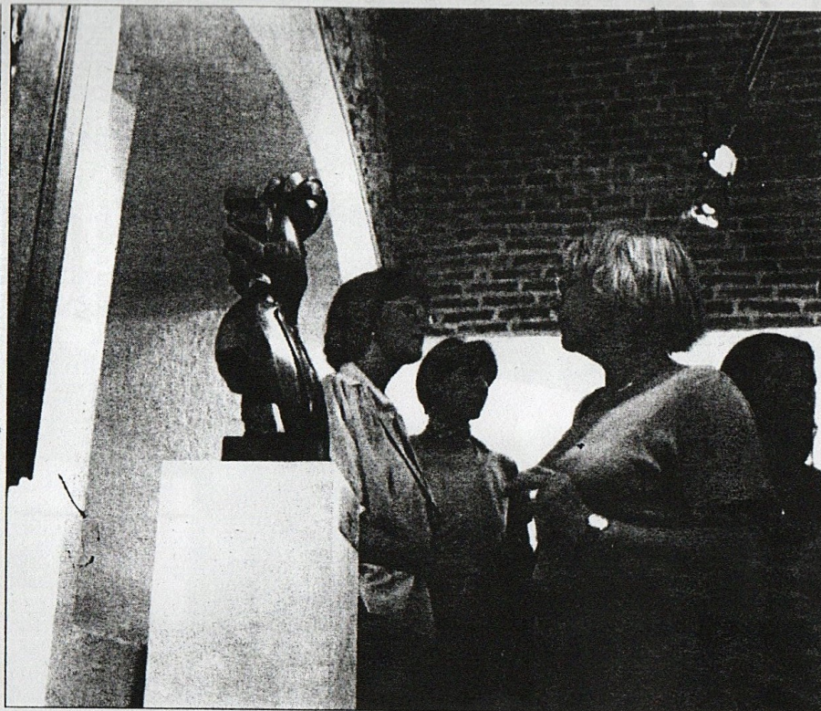
Návštěvníci vernisáže výstavy Vyšehrad Lughnasadh '99 si prohlížejí díla s keltskou tematikou