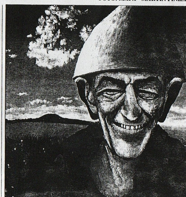
Obraz Každého Kelta chrání celta, také vystavený na Vyšehradě, maloval Josef Ryzec