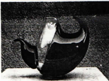
Dílo skupiny L'Anverre z výstavy v galerii Červená tráva.